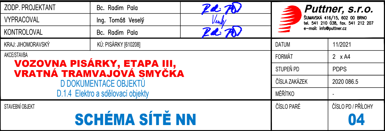
SCHÉMA SÍTĚ NN